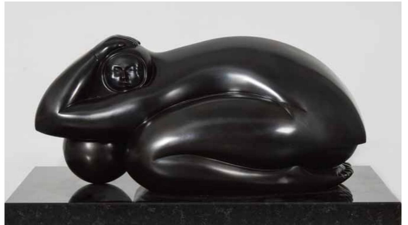
RENACER | Bronze | 12.5 x 23.6 x 14.1 in. | 32 x 60 x 36 cm