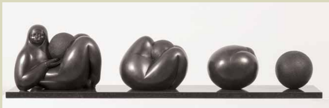
GÉNESIS RECUERDO PROFUNDO | Bronze | 19.6 x 78.7 x 17.7 in. | 50 x 200 x 45 cm