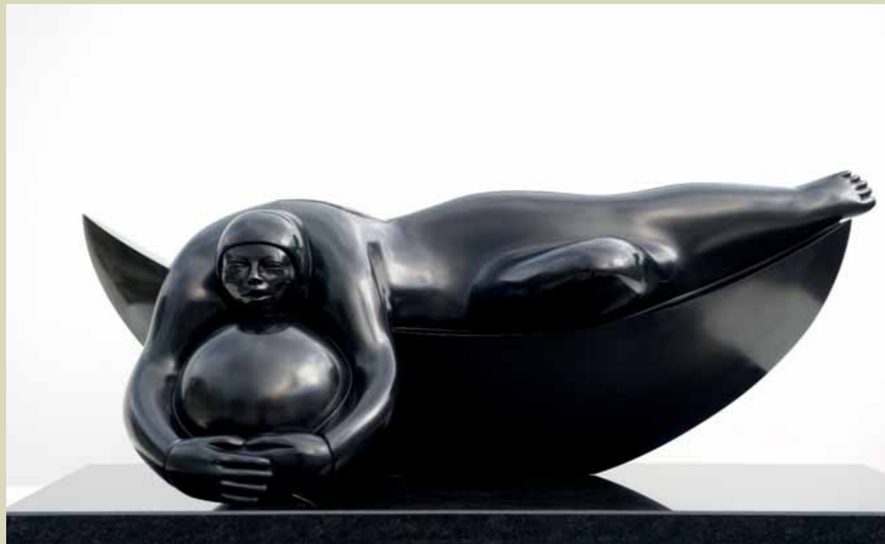
ARMONÍA | Bronze | 16.1 x 38.1 x 17.7 in. | 41 x 97 x 45 cm