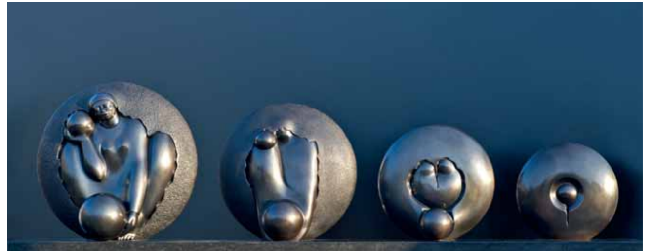
GÉNESIS ALQUIMIA | Bronze | 24.8 x 88.9 x 15.7 in. | 63 x 226 x 40 cm