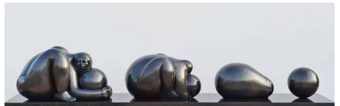
GÉNESIS FUERZA ANCESTRAL | Bronze | 17.3 x 96.8 x 20.8 in. | 44 x 246 x 53 cm