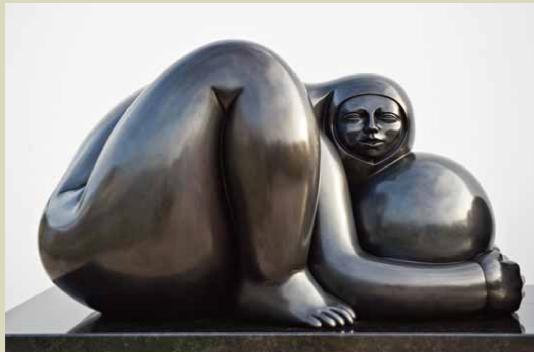
FUERZA ANCESTRAL | Bronze | 17.3 x 30.7 x 21.6 in. | 44 x 78 x 55 cm