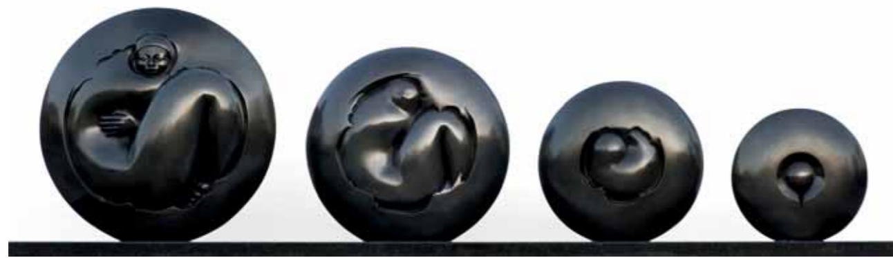
GÉNESIS EVOLUCIÓN | Bronze | 25.1 x 92.5 x 13.7 in. | 64 x 235 x 35 cm