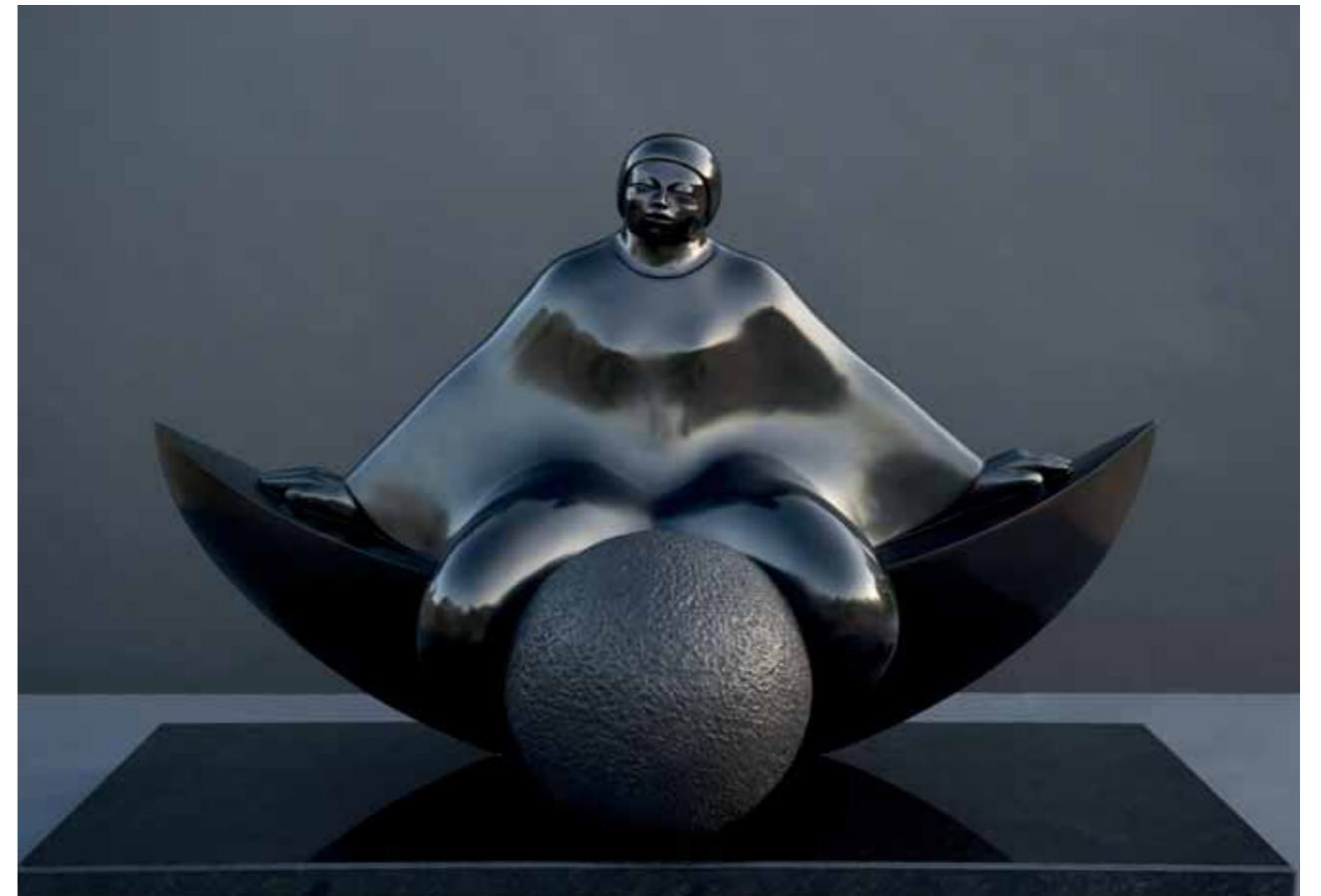
SUEÑO | Bronze | 23.6 x 38.1 x 18.8 in. | 60 x 97 x 48 cm