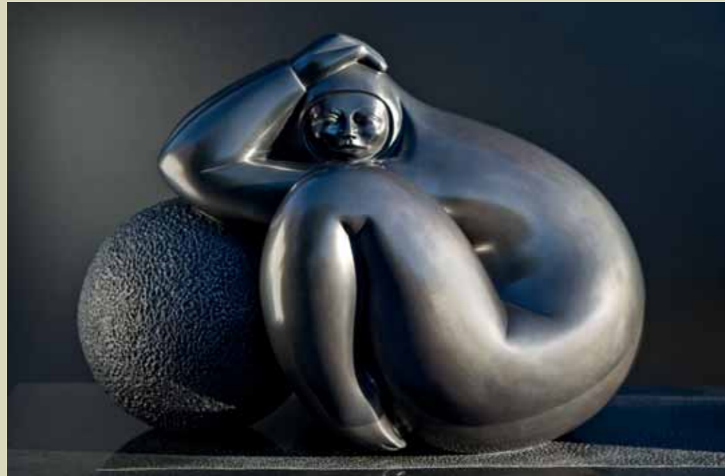
ENSUEÑO | Bronze | 18.1 x 22.8 x 18.1 in. | 46 x 58 x 46 cm