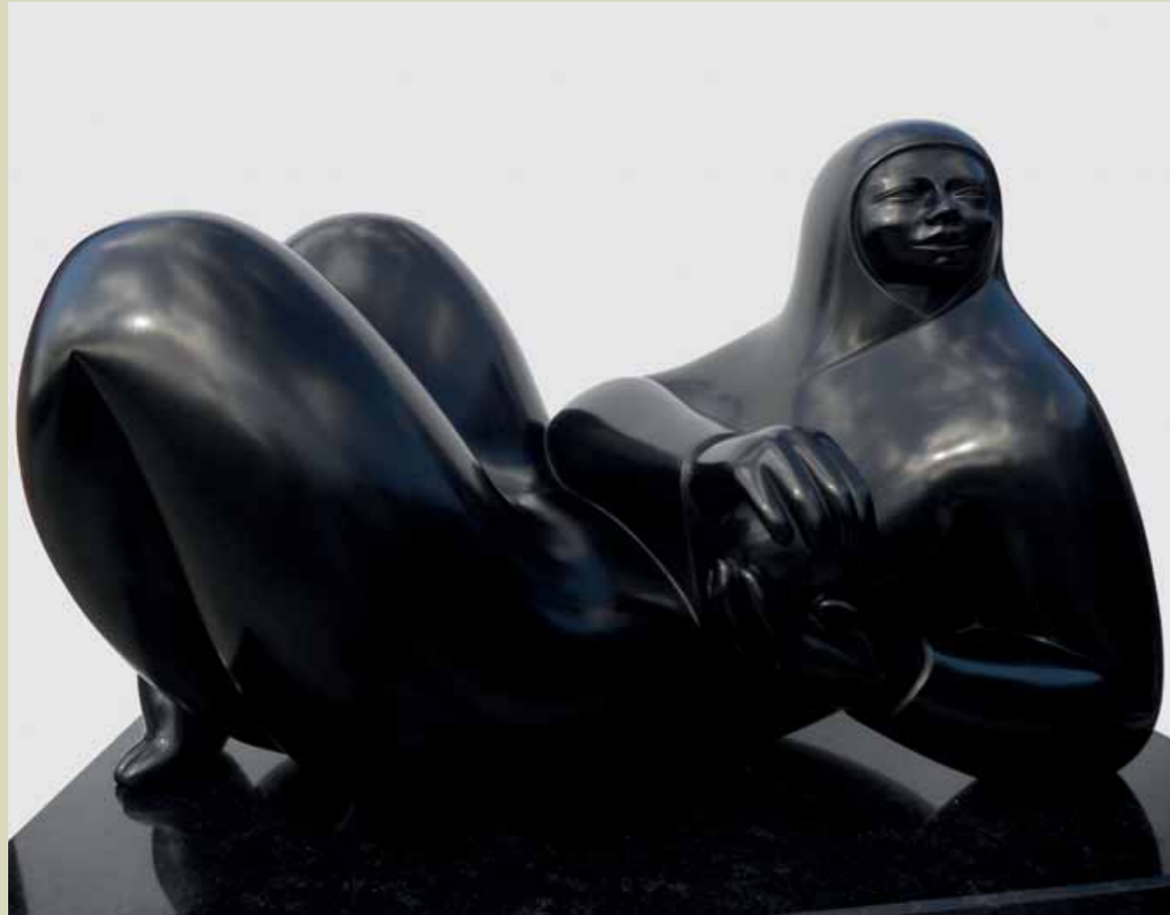
CREPÚSCULO | Bronze | 14.9 x 23.6 x 14.1 in. | 38 x 60 x 36 cm