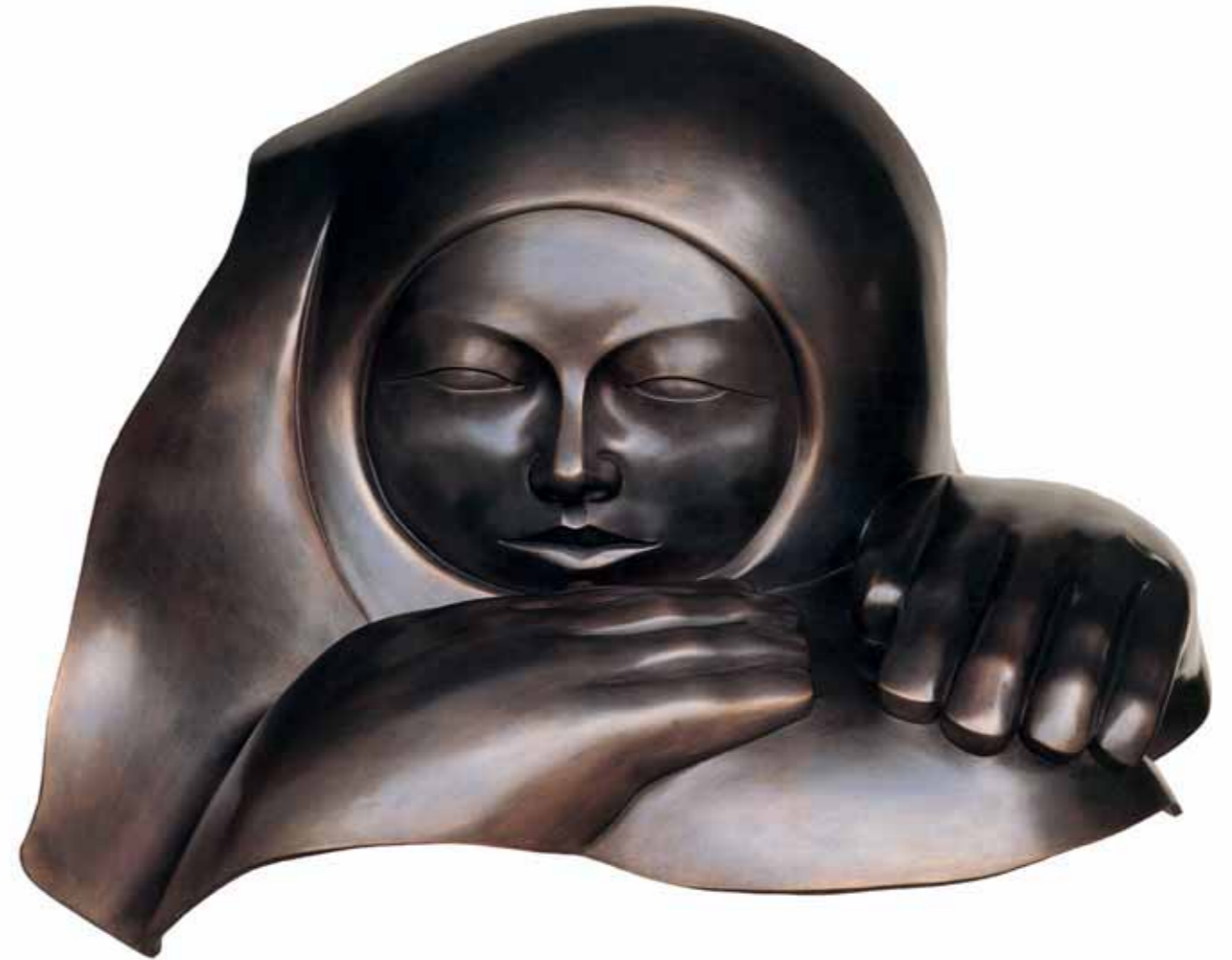
ÁNIMA | Bronze | 20.8 x 33 x 25.9 in. | 53 x 84 x 66 cm