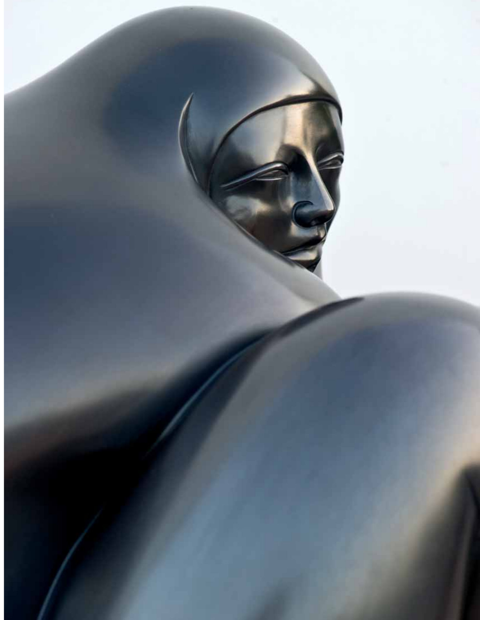
ARRULLO | Bronze | 18.8 x 32.6 x 19.6 in. | 48 x 83 x 50 cm