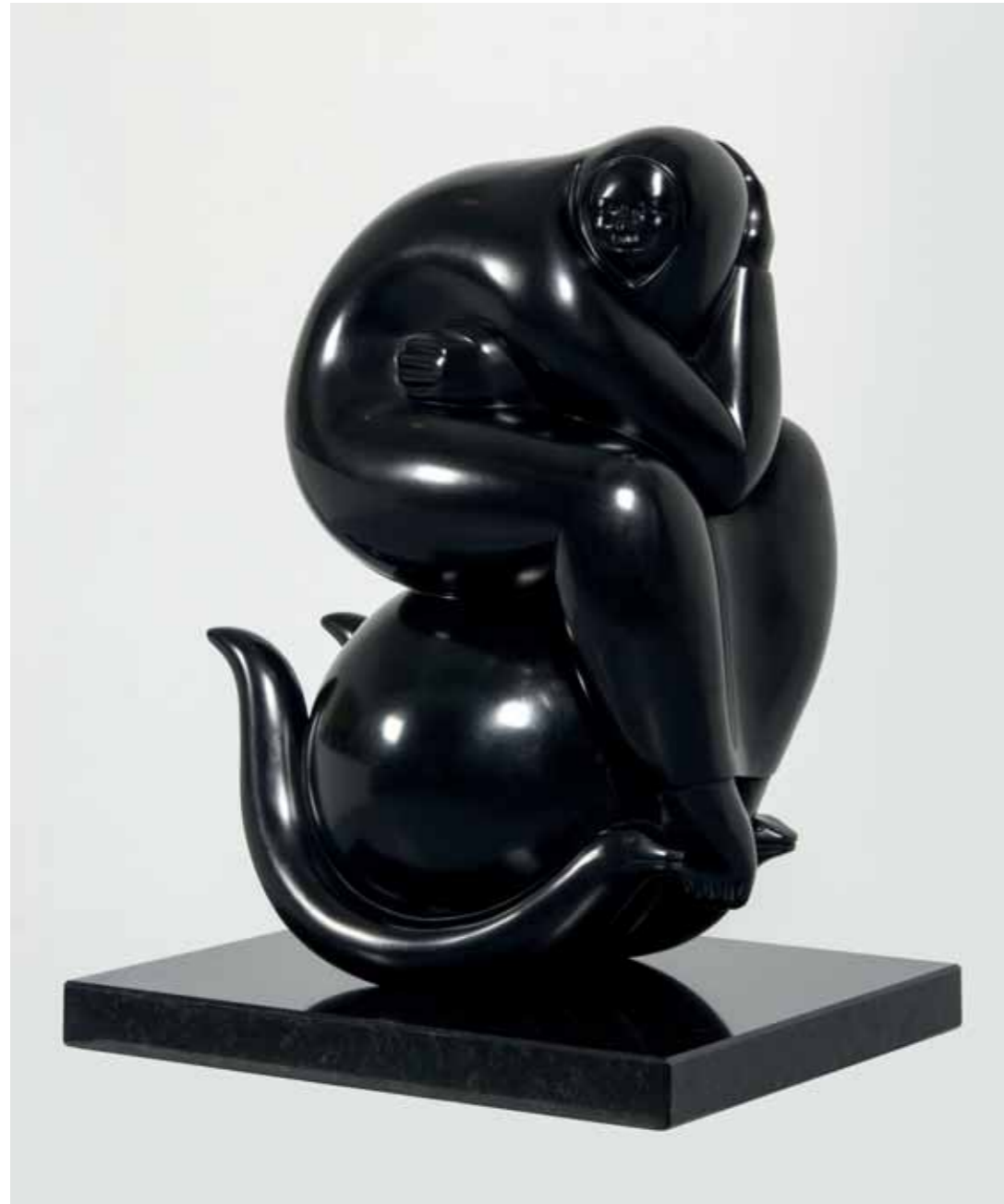
MITO | Bronze | 22.4 x 15.3 x 10.2 in. | 57 x 39 x 26 cm