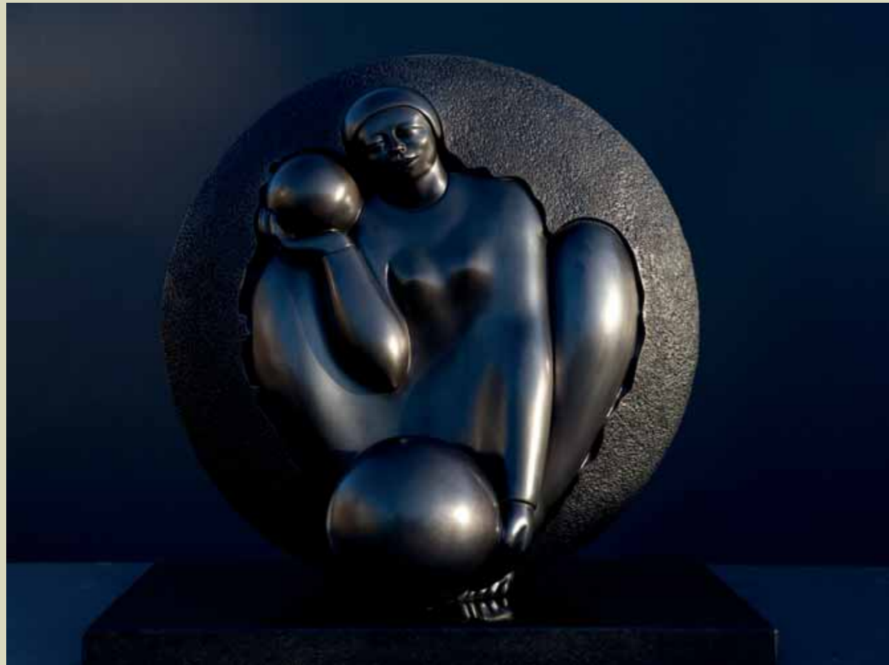
ALQUIMIA | Bronze | 26.7 x 25.9 x 17.7 in. | 68 x 66 x 45 cm