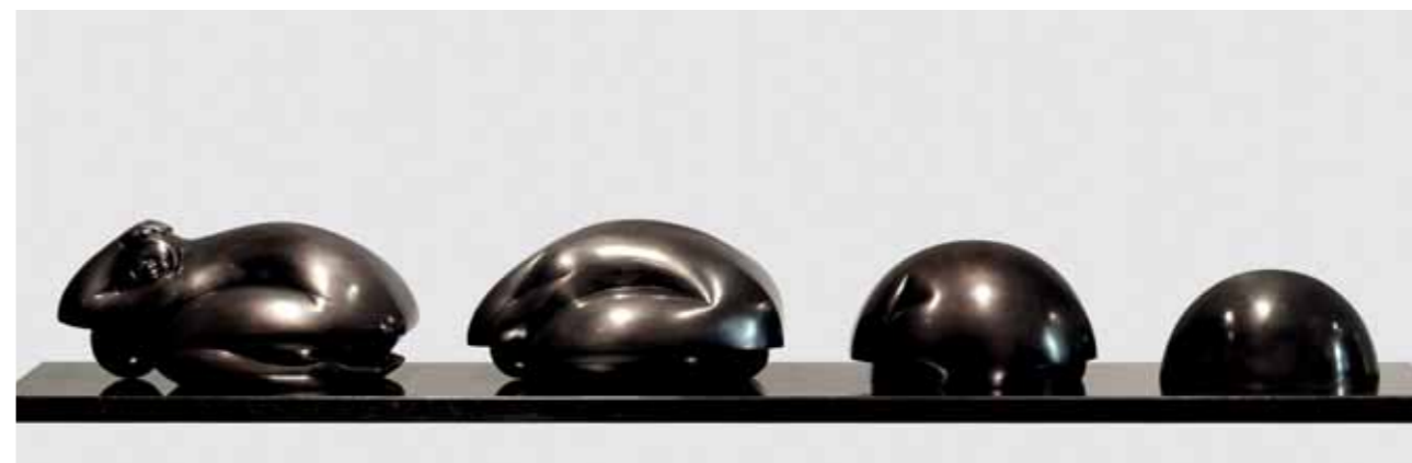
GÉNESIS PERÚ | Bronze | 13.7 x 92.5 x 13.7 in. | 35 x 235 x 35 cm