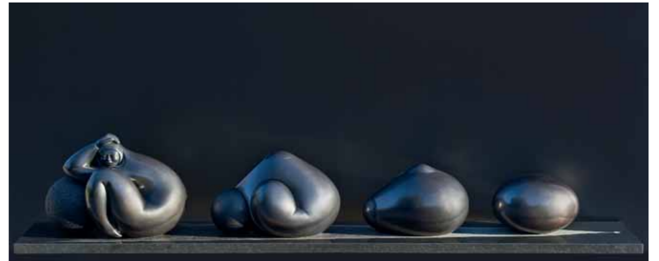
GÉNESIS ENSUEÑO | Bronze | 18.1 x 94.4 x 17.7 in. | 46 x 240 x 45 cm