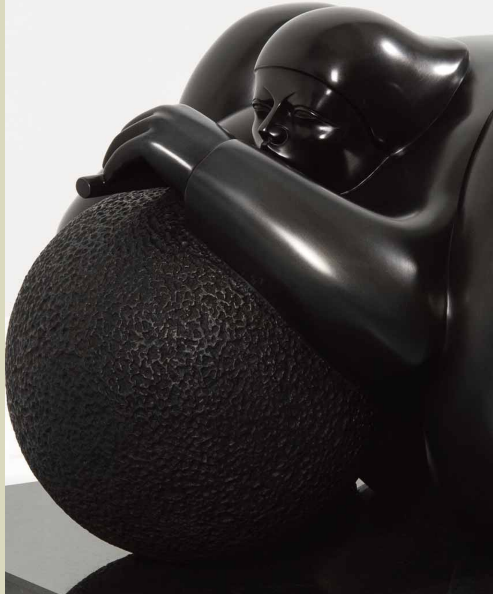
MELODÍA | Bronze | 16.1 x 22.8 x 17.7 in. | 41 x 58 x 45 cm