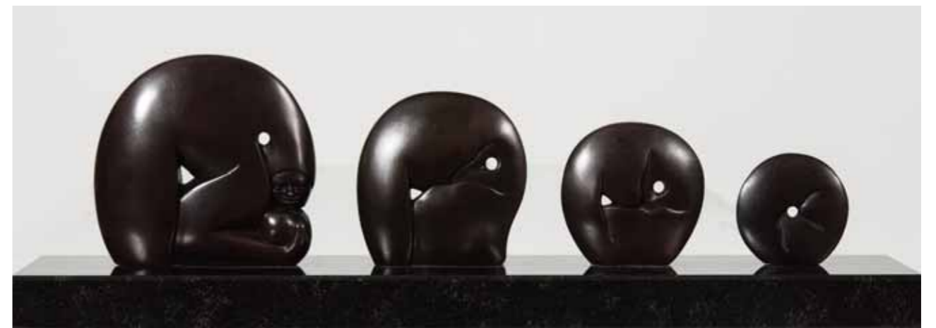
GÉNESIS CANTO A LA VIDA | Bronze | 25.1 x 86.6 x 11.8 in. | 64 x 220 x 30 cm