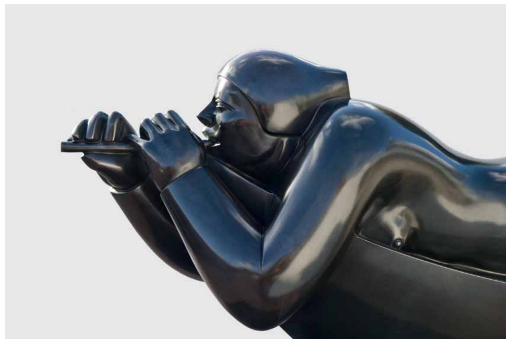
SINFONÍA | Bronze | 18.1 x 41.3 x 12.2 in. | 46 x 105 x 31 cm