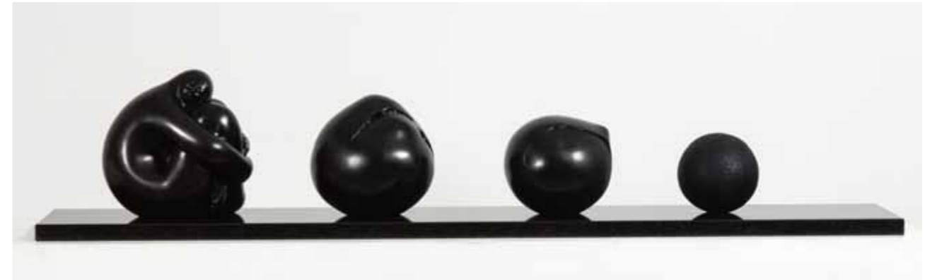
GÉNESIS MUJER ESFÉRICA | Bronze | 15.7 x 78.7 x 13.7 in. | 40 x 200 x 35 cm