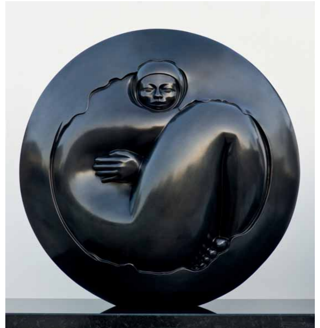
EVOLUCIÓN | Bronze | 26.1 x 25.1 x 11.8 in. | 66.5 x 64 x 30 cm