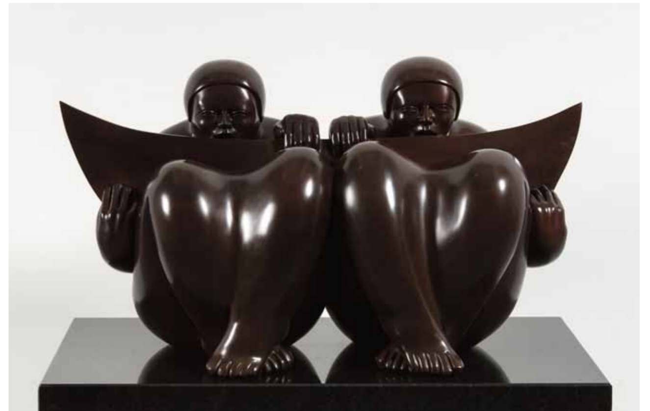
GEMELOS | Bronze | 17.7 x 28.7 x 17.7 in. | 45 x 73 x 45 cm