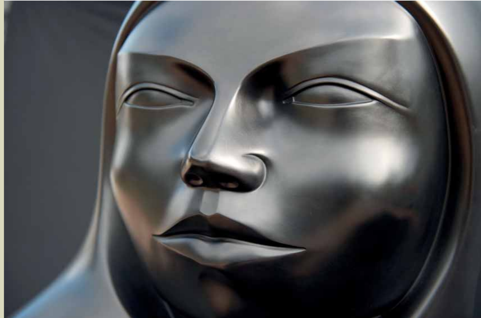
INTENSIDAD | Bronze | 30.7 x 31.4 x 22 in. | 78 x 80 x 56 cm