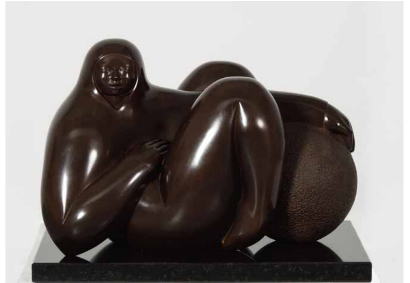
SERENIDAD | Bronze | 18.8 x 25.5 x 16.9 in. | 48 x 65 x 43 cm