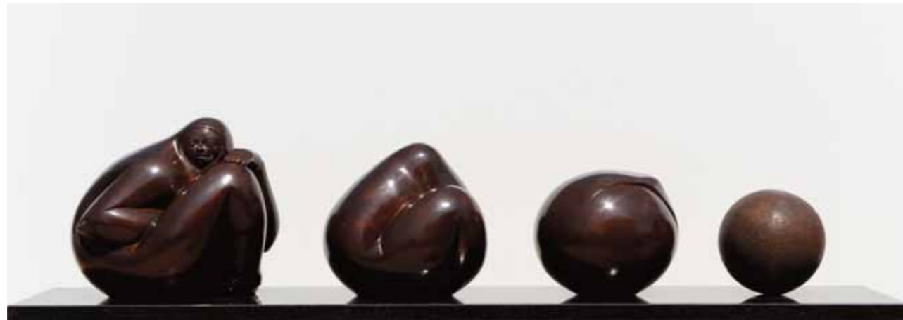
GÉNESIS COSTA RICA | Bronze | 19.6 x 82.6 x 19.6 in. | 50 x 210 x 50 cm