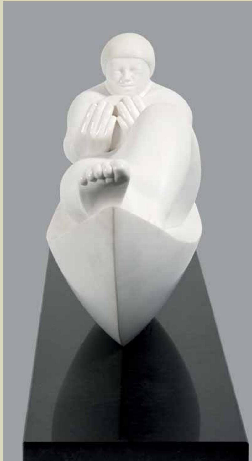
INTIMIDAD | White Marble from Greece | 19.2 x 39.3 x 11.8 in. | 49 x 100 x 30 cm