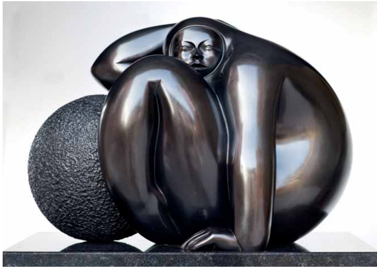
SILENCIO | Bronze | 16.1 x 22 x 15.7 in. | 41 x 56 x 40 cm